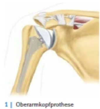
1 | Oberarmkopfprothese

Schulterendoprothesen bestehen aus körperverschträglichen Titan oder CobaltChromLegierungen, die je nach Knochenqualitat zementiert oder zementfrei eingesetzt werden. Bei Patienten uber 70 Jahren werden Endoprothesen meist mit einem schnell hartenden Kunststoff, dem so genannten Knochenzement, eingesetzt. Der Pfannenersatz wird in fast allen Fallen mit Zement im Knochen verankert und besteht in der Regel aus einem speziellen sehr harten Kunststoff (hoch vernetztes Polyethylen).