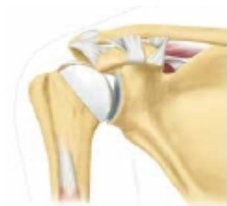
3 | Oberflachenersatz