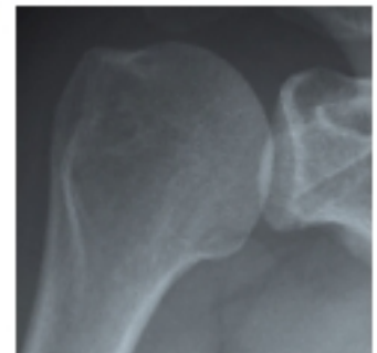
3 | Gesunde Schulter im Röntgenbild