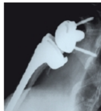
4 | Inverse Schultertotalendoprothese im Röntgenbild