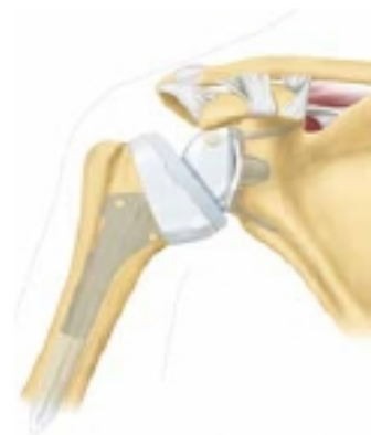
3 | Inverse Schulterendoprothese

Die inverse Endoprothese wird meist bei Patienten ab dem 65. Lebensjahr eingesetzt. Voraussetzung ist eine unversehrte Deltamuskulatur und eine gute Knochensubstanz zur stabilen Verankerung des Endoprothesenkopfes in der Schulterpfanne.