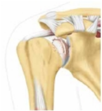
1 | Arthrose der Schulter

Ist die Arthrose schon weit fortgeschritten und der Gelenkknorpel stark angegriffen, reichen die nichtoperativen Behandlungsverfahren oft nicht mehr aus. Ein künstliches Gelenk kann dann die Chance auf ein neues Leben in Bewegung bieten.