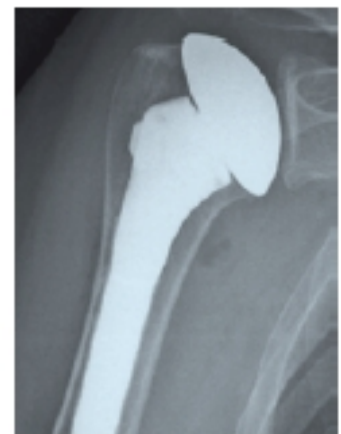
2 | Oberarmkopfprothese im Rontgenbild