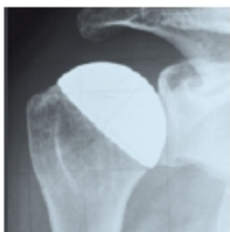
4 | Oberflachenersatz im Rontgenbild